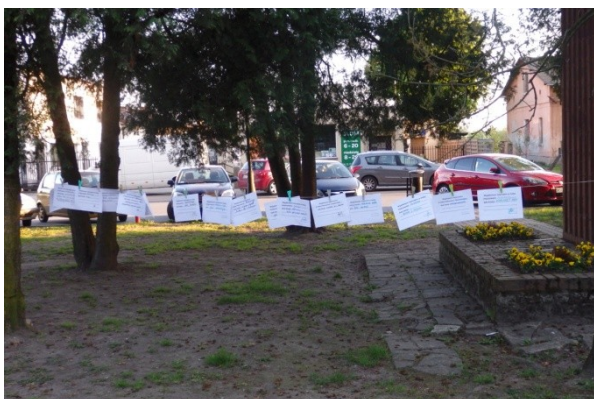
Działanie animacyjne przy GOK w Młodzieszynie.