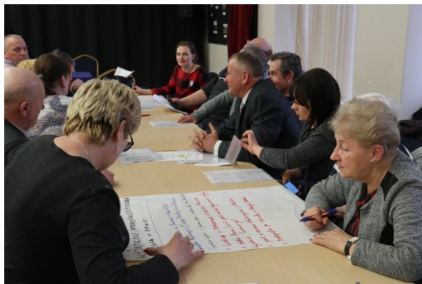
Warsztat diagnostyczny z radnymi i sołtysami.