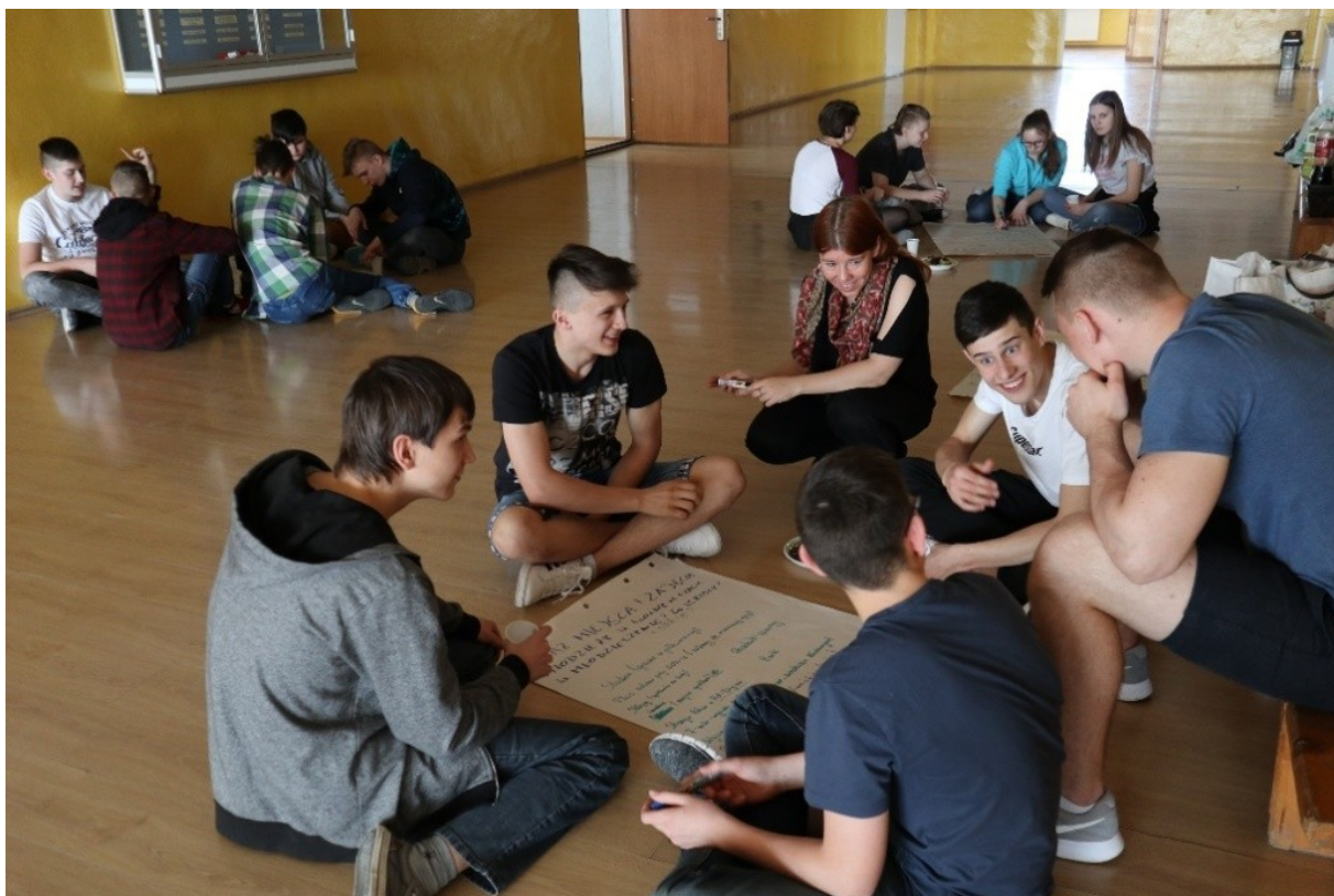
Klasa gimnazjalna ze szkoły w Młodzieszynie podczas warsztatu diagnostycznego.

Mimo że społeczeństwo gminy Młodzieszyn jest relatywnie młode, nie poświęca się w niej zbyt wiele uwagi potrzebom młodzieży. Nastolatki po opuszczeniu istniejącego dotychczas gimnazjum kształciły się dalej w miastach, a później bardzo często opuszczały gminę. Łatwo tutaj wpaść w pewien schemat myślowy – nie ma sensu nic robić dla młodych bo po pierwsze jest ich mało, a po drugie i tak zaraz wyjadą. Przykład wspomnianego już nauczyciela, któremu udało się zainteresować uczniów lokalną historią, pokazuje, że młodzież docenia działania starszych dla społeczności i potrafi być wdzięcznym odbiorcą przekazywanych im wartości.