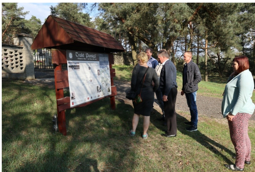
Zdjęcie ze spaceru na cmentarz w Mistrzewicach.

odbywały się liczne walki, zaś w 1939 roku miała miejsce bitwa nad Bzurą, czyli największe polskie działanie ofensywne kampanii wrześniowej. Pamiątką krwawych walk są dziś groby poległych na cmentarzach w Juliopolu, Starych Budach, Mistrzewicach, Radziwiłce i Leontynowie. Miejsca pamięci związane zwłaszcza z bitwą nad Bzurą są ważne dla tożsamości lokalnej mieszkańców.