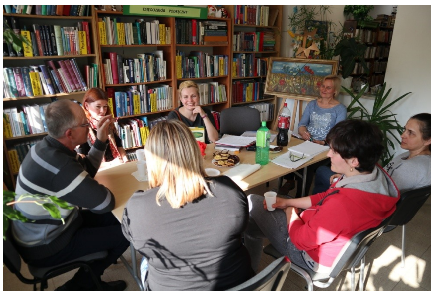
Warsztat diagnostyczny w bibliotece w Kamionie.

Biblioteka promuje czytelnictwo i stale rozbudowuje swoje zbiory książkowe. Jest aktywna w obszarach do niej należących, na przykład razem z GOK i Szkołą Podstawową w Młodzieszynie organizuje w Młodzieszynie akcję Narodowe Czytanie. Oprócz tego nie realizuje żadnych większych przedsięwzięć kulturalnych. Współpracuje ściśle z GOK, nie wchodzi przy tym w jego kompetencje. Instytucja robi wrażenie skupionej na swoich bieżących działaniach i funkcjonującej nieco na marginesie młodzieżowego życia.