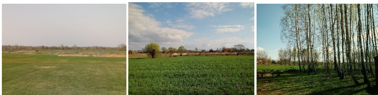
Młodzieżyska natura: (od lewej) rzeka Bzura, Mistrzewice, Adamowa Góra.

Natura dla mieszkańców gminy wiąże się w pewnym sensie z radością życia – przyjemnie spędzaniem czasem, odpoczynkiem, robieniem tego co się lubi. Mieszkańcy cenią sobie swoje otoczenie, może więc warto poszukać w nim inspiracji i tematów dla działań kulturalnych i integrujących społeczność gminy.