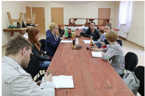
Warsztat diagnostyczny w Starych Budach.