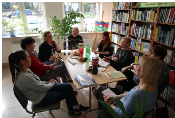
Wywiad z dyrektorką biblioteki w Młodzieszynie.