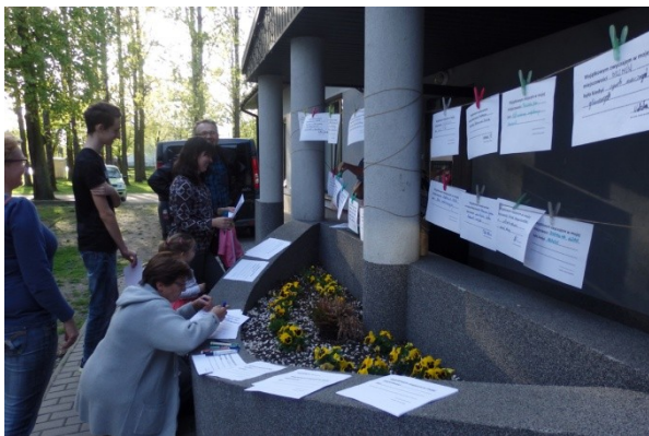
Działanie animacyjne przy GOK w Młodzieszynie.