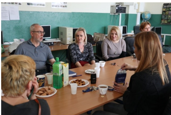
Warsztat diagnostyczny z radnymi i sołtysami.