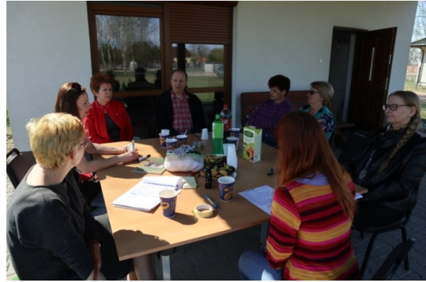
Warsztat diagnostyczny w Adamowej Górze.