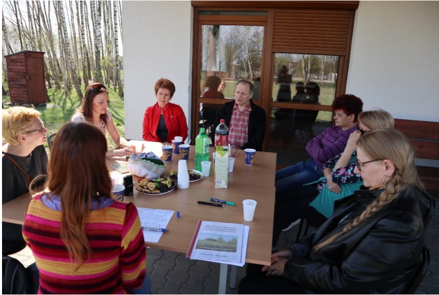
Warsztat diagnostyczny w Adamowej Górze.

Tutaj należy wspomnieć o specyfice społeczności Adamowej Góry – część mieszkańców stanowią osoby przyjezdne, które przenieśli się do wsi z Sochaczewa i nadal pozostają związane z tym miastem (Adamową Górę od Sochaczewa dzieli 15 minut drogi samochodem). To może wpływać na styl aktywności mieszkańców Adamowej Góry, jakże odmienny od reprezentowanego przez Aktywne Kobiety z Kamiona. Można się wręcz pokusić o określenie „aktywizm typu miejskiego”, który jest nacechowany większą mobilnością, większą łatwością w załatwianiu spraw na drodze administracyjnej, chętniejszym korzystaniem z instytucji kultury, nawet tych oddalonych. Różni się on od form działalności społecznej typowych dla polskiej wsi, koncentrujących swoje aktywności na przestrzeni ściśle lokalnej i stawiających raczej na samodzielne niż administracyjne rozwiązywanie problemów.