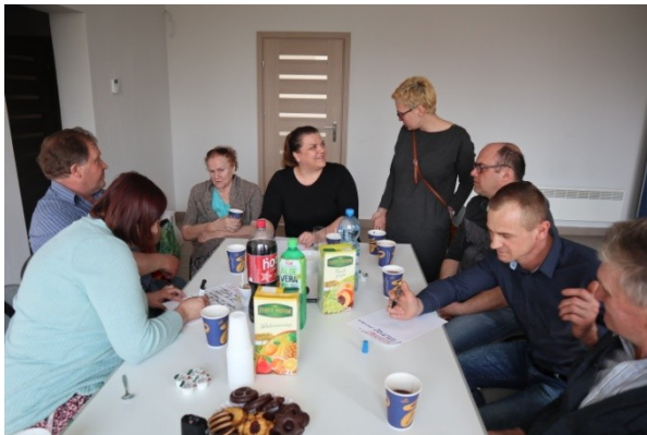
Warsztat diagnostyczny w Mistrzowicach.