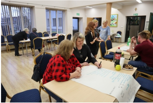
Warsztat diagnostyczny w Młodzieszynie.