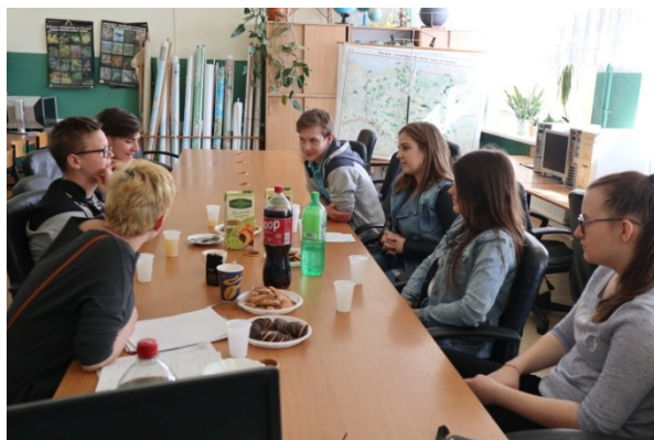
Warsztat diagnostyczny z młodzieżą gimnazjalną.